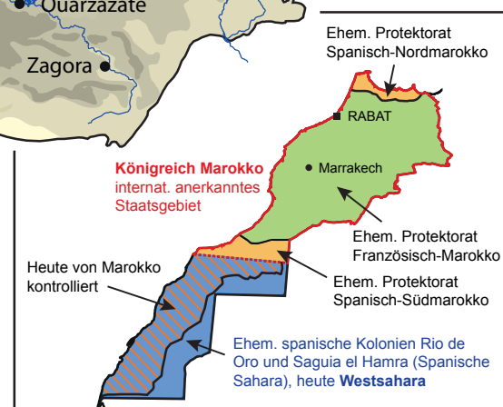
Koloniale Territorien bis 1956 bzw. 1976