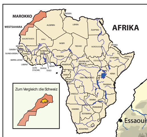
Topografie und Lage Marokkos